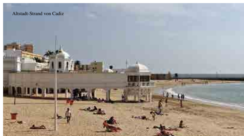
Altstadt-Strand von Cadiz

Turm aus hat man einen tollen Panoramablick auf Cádiz, das Meer und die Schiffe. An klaren Tagen sieht man sogar die marokkanische Küste. So nahe kommen sich Europa und Afrika an dieser Stelle. Und man kann deutlich die prominente Lage der Stadt auf der Landzunge erkennen – es ist beinahe eine Insellage, nur durch einen schmalen Streifen mit dem Festland verbunden. Um die Stadt vor Feinden zu schützen, sind direkt am Meer die Burgfestung „Castillo de San Sebastián“ und ein paar hundert Meter weiter die Festung „Castillo de Santa Catalina“ errichtet worden. Die Verteidigungsanlagen entstanden, nachdem Freibeuter aus dem Norden die Stadt überfallen hatten – und nirgendwo war damals so viel zu holen wie in Cádiz. In den apokalyptischen Jahren 1587 und 1596 hatten sich Sir Francis Drake und der Graf von Essex der Stadt bemächtigt, sie ausgiebig geplündert und vollständig zerstört. So erklärt sich auch, dass nur wenige arabische und gotische Bauwerke zu sehen sind. Herrliche Strände finden sich rings um die Stadt, nur Minuten vom Stadtzentrum entfernt. Dort ging im Jahre 2002 übrigens Halle Berry an Land – als Schauspielerin im James-Bond-Film „Stirb an einem anderen Tag“. Cádiz musste dabei als Havanna herhalten. Und das war sicher gar nicht so